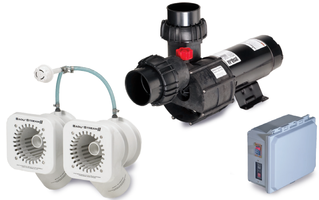
Paquete A (con cubierta cuadrada)