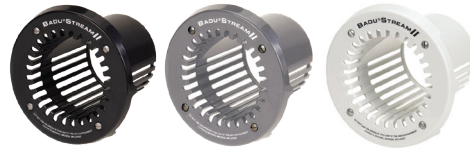
Las cubiertas redondas están disponibles en negro, gris y blanco.